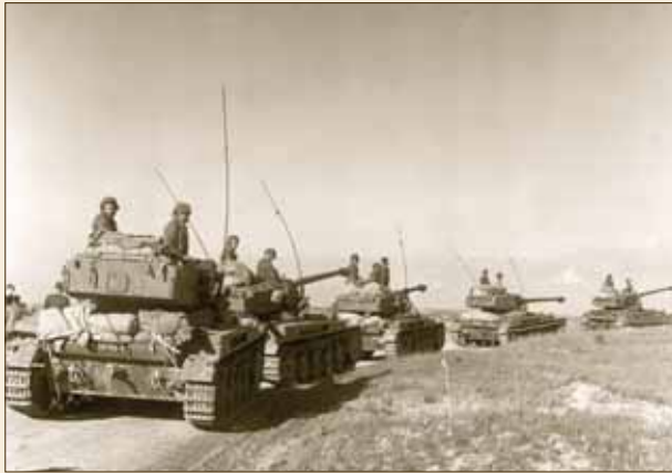
פינוי כוחות צה"ל מרצועת עזה, 7 במרס 1957. גנזך המדינה

בחירת התעודות ועבודת העריכה נעשות בידי צוות של היסטוריונים מקצועיים ועובדים בכירים בדימוס של משרד החוץ, ולחברי הצוות יש גישה חופשית גם לתיעוד שעדיין לא נחשף לציבור.