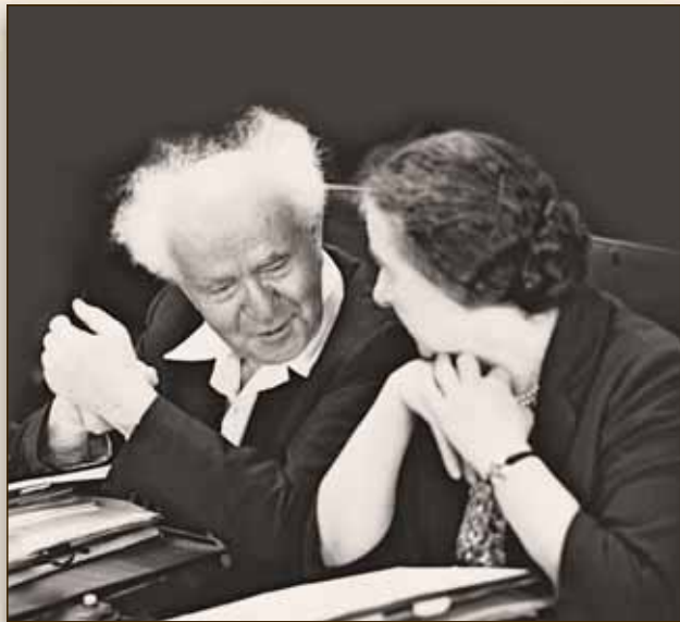
עורכת הספר: ננה שגיא